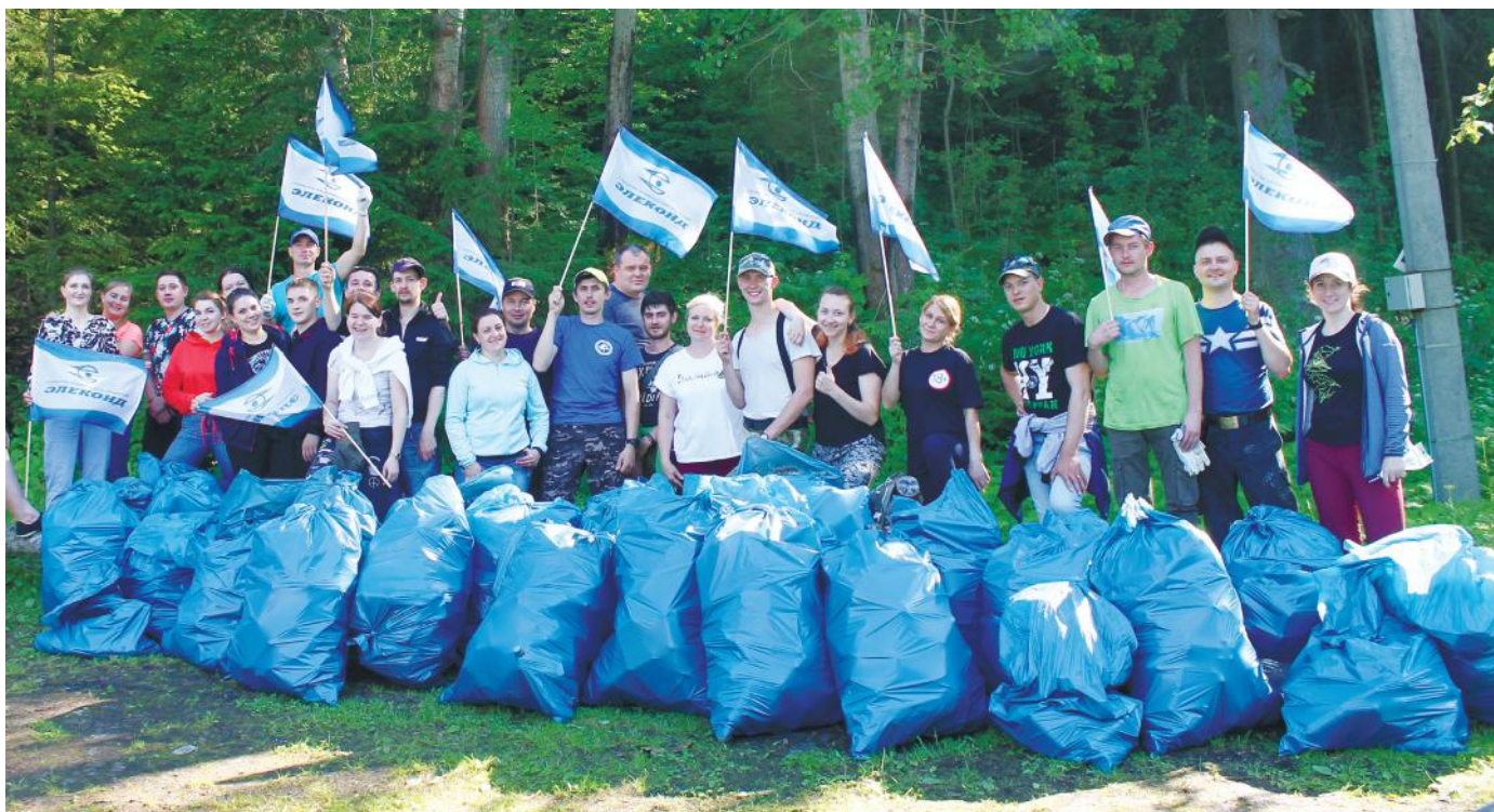
Активисты молодежного движения на базе отдыха «Ивушка», июль 2020 года

Практически все секторы русла реки имели свои сложности в рельефе, берега были труднодоступны и сильно засорены. За 2,5 месяца проведения санитарных работ сотрудники городских предприятий и организаций убрали с прибрежных территорий более 85 тонн мусора и около 700 кубических метров поросли деревьев и кустарников. За участие в этой экологической акции Благодарности Администрации г. Сарапула теперь есть и в копилке достижений работников ОАО «Элеконд».